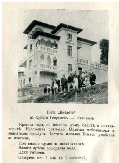
Фиг. 5. Реклама на вила „Венера“ Фиг. 6. Реклама на вила „Виолета“

Отпечатването на книгата е било възможно благодарение на рекламите на: „Р. Шилдхауер“, генерален представител на концерна „Демаг“, „Бабкос – Вилкокс – Оберхаузен“, „Вайзе – Зьоне“, „Амаг – Хилперт“, „Фелден и Гьом – Карлсверк“, „Гарбе, Ламайер и Ко“ и „Хартман и Браун – Франкфурт“, Държавни каменовъглени мини „Перник“, Българско акционерно дружество „Гранитоид“, шоколадова фабрика „Пеев“ (фиг. 7).