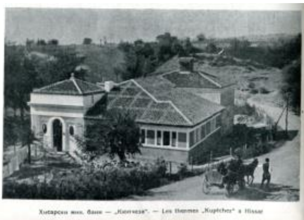
Фиг. 13. Баня „Кюпчеза“ в Хисаря, снимка от „Бани и летовища в България“

В известна степен сходно е изданието „Бани и летовища в България“, където наред с морските бани, летовищата и речните бани са включени и минералните бани (фиг. 12, 13). Книгата съдържа също ценни снимки, но за съжаление, е отпечатана на лошокачествена и разпадаща се хартия, като само корицата е с по-добро качество, цветна е и съдържа реклами.