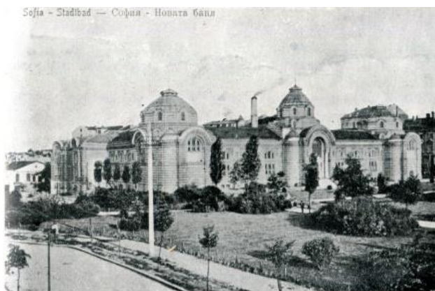
Фиг. 11. Централна баня (Голямата баня) в София