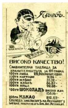
Фиг. 7. Реклама на шоколадова фабрика „Пеев“