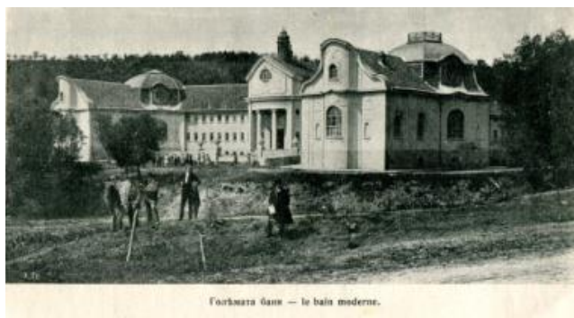
Фиг. 4. Голямата баня в Банкя

Изданията за минералните извори дават и ценна историческа информация за стойността и вариантите на услугата. За едно къпане се е плащало: