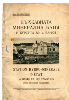
Фиг. 3. Корица на книгата на д-р Ал. Георгиев

Книгата съдържа това, което виждаме като задължително и в повечето подобни издания: топография на околността, сведения за селището, брой на баните в него, какви са били старите бани, геологично устройство на терена, от който извират термалните води, хващане и каптиране на термалната минерална вода, отвеждане на водата от каптажа до баните, химически състав на водата, кои болести се лекуват, упътвания и съвети към болните, минералната вода за вътрешна употреба, вътрешния ред в баните, такси и наредби за къпанятия в държавната минерална баня в с. Банки (днес Банкя).