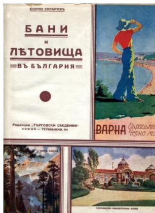
Фиг. 12. Корица на „Бани и летовища в България“