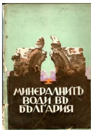
Фиг. 10. Корича на „Минералните води в България“

„Минералните води в България“ е вероятно най-добре илюстрираната книга за баните, а поместените снимки са документ за състоянието на постройките по това време (фиг. 10, 11). Ето защо книгата е незаменим източник за българската архитектура, тъй като много от баните днес са в руини или изоставени. Любопитно е да се види и тяхната околност.