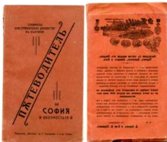
Фиг. 1. Корица на пътеводителя на София и околността ѝ. Реклама на I-ва Софийска фабрика за вълнени платове на Д. Беров & А. Хоринек на задната корица на пътеводителя

– от ползването на водата за миене или пране до оползотворяването на лечебните ѝ свойства. Процесът е продължителен, защото още след Освобождението започва да се отделя внимание на тези води. 2