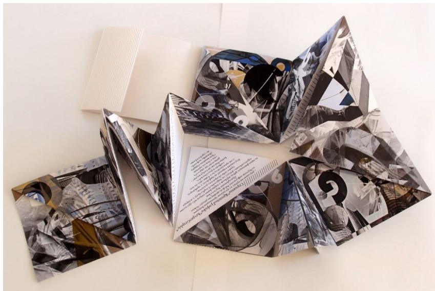
Фиг. 7. Регина Далкалъчева. Концептуална арт книга в ограничен авторски тираж с неконвенционална пространствена форма „ТРИъгълни / ТРИлистови / ТРИстишия – P.S.“, 2023 г. Формат 23 x 23 см; графични рисунки с молив, графитен прах, темпера и обемна структурна паста, които са деконструирани, трансформирани, надрисувани и колорирани чрез средствата на графичния дигитален софтуер; Digital giclee fine art print, пигментни мастила върху сертифицирана хартия за артистичен печат High Color Contrast (240 g/m 2 , 50% памук). Полутвърда корица от картон Fabriano 5 (300 g/m 2 ), с ръчно рязане, биговане, сгъване и щанцоване. Книжното тяло е осъществено чрез неконвенционално сгъване и скрепване на един-единствен голямоформатен печатен лист. Арт книгата е осъществена в лимитиран (ограничен) авторски тираж от 15 екземпляра, които са ръчно номерирани, датирани и сигнирани от художничката.