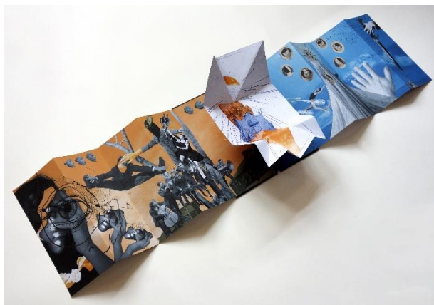
Фиг. 9. Дора Иванова. Концептуална арт книга в ограничен авторски тираж с неконвенционална пространствена форма „Минало свършено / Минало недовършено“, 2020 г. Формат на книжното тяло 31,5 x 13,5 см, формат при двупосочно разгъване на крилата на олтарното лепенело 31,5 x 135 см; дигитален колаж, авторска типография; Digital giclee fine art print, пигментни мастила върху сертифицирана хартия за художествен графичен печат Canson Infinity (270 g/m 2 , 100% памук). Ограничен авторски тираж от 30 екземпляра, ръчно сигнирани, номерирани и датирани. (Арт книгата е реализирана като дипломен проект в магистърска програма „Илюстрация“ на специалност „Книга, илюстрация, печатна графика“, НХА).