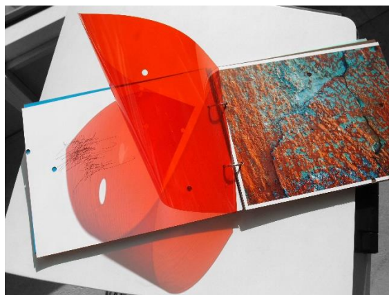
Фиг. 6. Регина Далкалъчева. Концептуална арт книга „Берлинската стена“, 2015 г. Формат 21 x 29,7 см; авторска фотография, авторска калиграфия; Digital giclee fine art print, пигментни мастила върху сертифицирана хартия за художествен графичен печат Hahnemühle Fine Art – William Turner хартия (190 g/m 2 , 100% памук), цветни прозрачни PVC плаки с щанци, цветен паус, корица от велпапе. Ръчно книговеждане, скрепване на книжното тяло с метални рингове. Арт книгата е реализирана в лимитиран авторски тираж от седем екземпляра, ръчно сигнирани и номерирани от художничката.