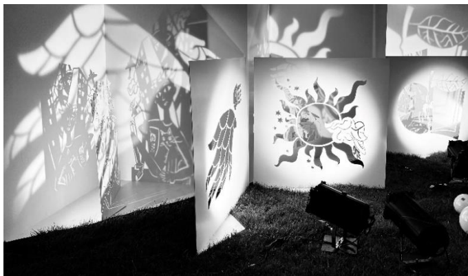
Фиг. 5. Капка Кънева. Арт книга светлинна инсталация „История за &“, 2023 г. Формат на една страница / инсталационен обект 238 x 238 см, обща ширина на инсталацията 12 м; стомана, лазерно щанцоване, сценични прожектори. Арт книгата е реализирана в единична машинно тиражирана бройка и представлява конструкция тип дипляна с три разтвора и три двойки ажурни панели.