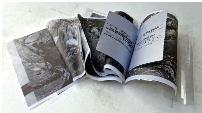
Фиг. 3. Регина Далкалчева. Арт книга в ограничен авторски тираж с неконвенционална пространствена форма и материалност „Призоваване на океана“, 2024 г. Авторска визуална интерпретация на „Първа песен, девета строфа“ от „Песните на Малдорор“ на Лотреамон. Формат 39 x 27 см; рисунки с молив, които са дигитално трансформирани и надградени; Digital giclee fine art print, пигментни мастила върху мелинекс (270 g/m 2 ), корица от прозрачна PVC плака (300 g/m 2 ). Ръчно книговезване, концевево шиене и скрепване на книжното тяло и корицата. Арт книгата е осъществена в ограничен (лимитиран) авторски тираж от 15 екземпляра, всеки от които е ръчно сигниран, номериран и датиран от художничката.