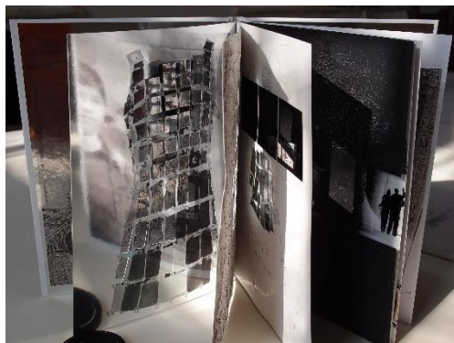
Фиг. 1. Регина Далкалъчева. Арт книга – уникат „Чуждият“, 2012/2013 г. Формат 19,5 x 26,5 см; CGD, ръчен Toner transfer на пигментни мастила върху сертифицирана хартия за художествен графичен печат Canson Infinity (270 g/m 2 , 100% памук). Авторска фотография, авторска калиграфия, ръчно щанцоване, деструктуриране и надрисуване на трансферирания образ. Ръчно книговеждане на книжното тяло.