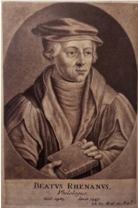
Фиг. 1. Беатус Ренанус. Гравюра на Жан-Жак Хайд от XVII век (Adam 2001)

През периода 1441–1477 г. начело на Латинското училище е Луи Дрингенберг (Ludwig Dringenberg, роден между 1410 и 1415 г., починал през 1477 г.), преподавател с голям талант, който въвежда педагогическите методи на рейнския хуманизъм. Той обръща особено внимание на нормите на граматиката, с което възпитава у учениците си вкус към правилния начин на изразяване. В желанието си не само да създаде от тях истински литератори, но и да ги изгради като добри хора, Дрингенберг се старее да им даде качествено религиозно обучение, което заема широко място в училищната програма. Едновременно с това той насочва интереса им и към изучаване на историята и миналото на родния край.