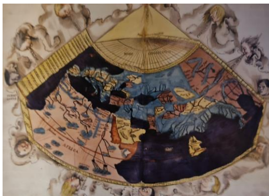
Фиг. 5. Карта на света от „Географията“ на Птолемей. Издание от 1520 г. на Жан Шот в Страсбург (Naas, Meyer 2004)