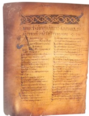
Фиг. 6. Ръкопис „Кирилска лексика“ от XII век (Adam, 2001)

Запазената до днес ученическа тетрадка на Ренанус от 1498 и 1499 г., когато той е на 13 и 14 години, позволява да се добие представа за обучението на учениците, които посещават Латинското училище. През 1498 г. те четат книги на Овидий, а следващата година е посветена на Вергилий. От друга страна, някои бележки по тетрадката загатват за бъдещия книжовник.