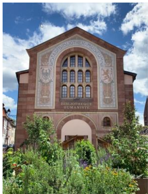
Фиг. 2. Фасадата на Хуманистичната библиотека в Селеста

стойностните в областта. Чрез нейното съдържание може не само да се проследи интелектуалното развитие на един от най-известните хуманисти на Елзас, но и да се реконструират литературните и религиозните интереси и занимания по време на една голяма епоха от историята на региона (Adam 2001).